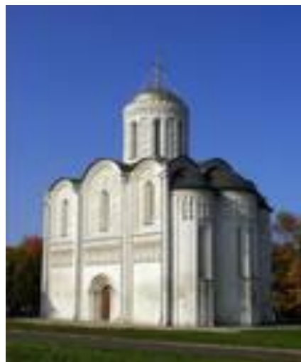
Храм Покрова на Нерли