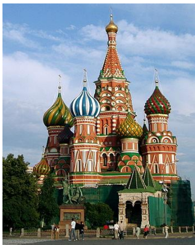
Храм Василия Блаженного, или храм Покрова Пресвятой Богородицы на рву.